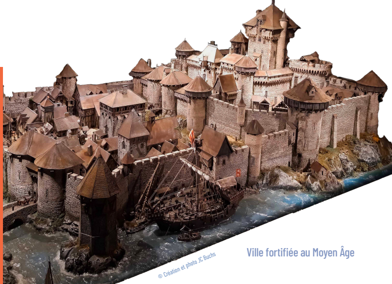
Ville fortifiée au Moyen Âge

Le marché français est l'un des plus dynamiques d'Europe sur ce segment.