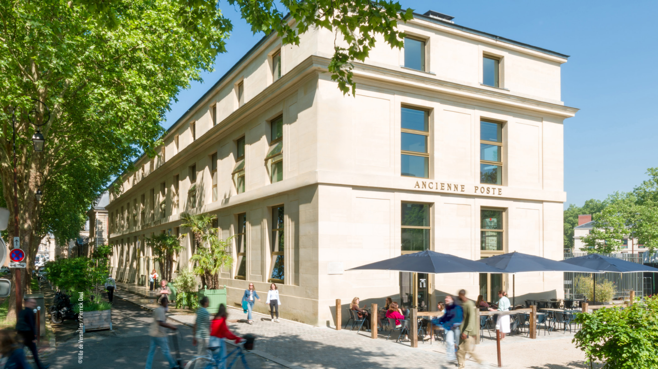
Ancienne Poste depuis l'Avenue de Paris