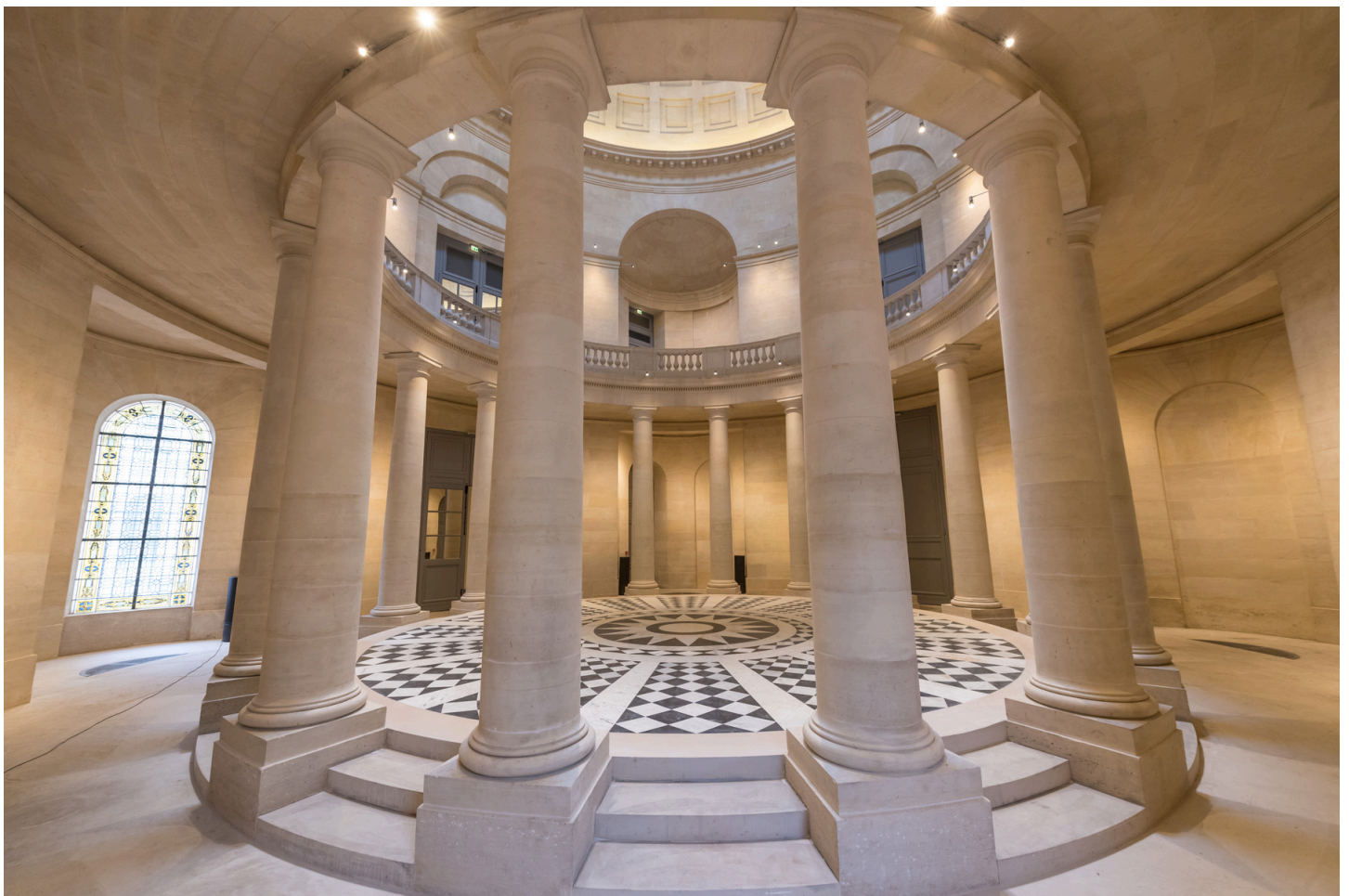
La chapelle Richaud, 2015

Chaque année, l'espace Richaud présente des expositions temporaires patrimoniales, photographiques et d'art contemporain avec une programmation culturelle spécifique ainsi qu'une découverte de l'histoire et l'architecture de ce patrimoine versaillais. Une belle occasion d'accueillir les scolaires !