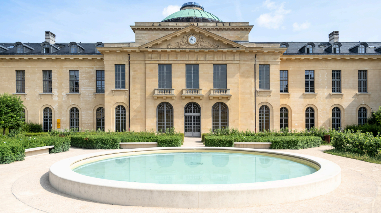
L'hôpital Richaud et son jardin, 2023